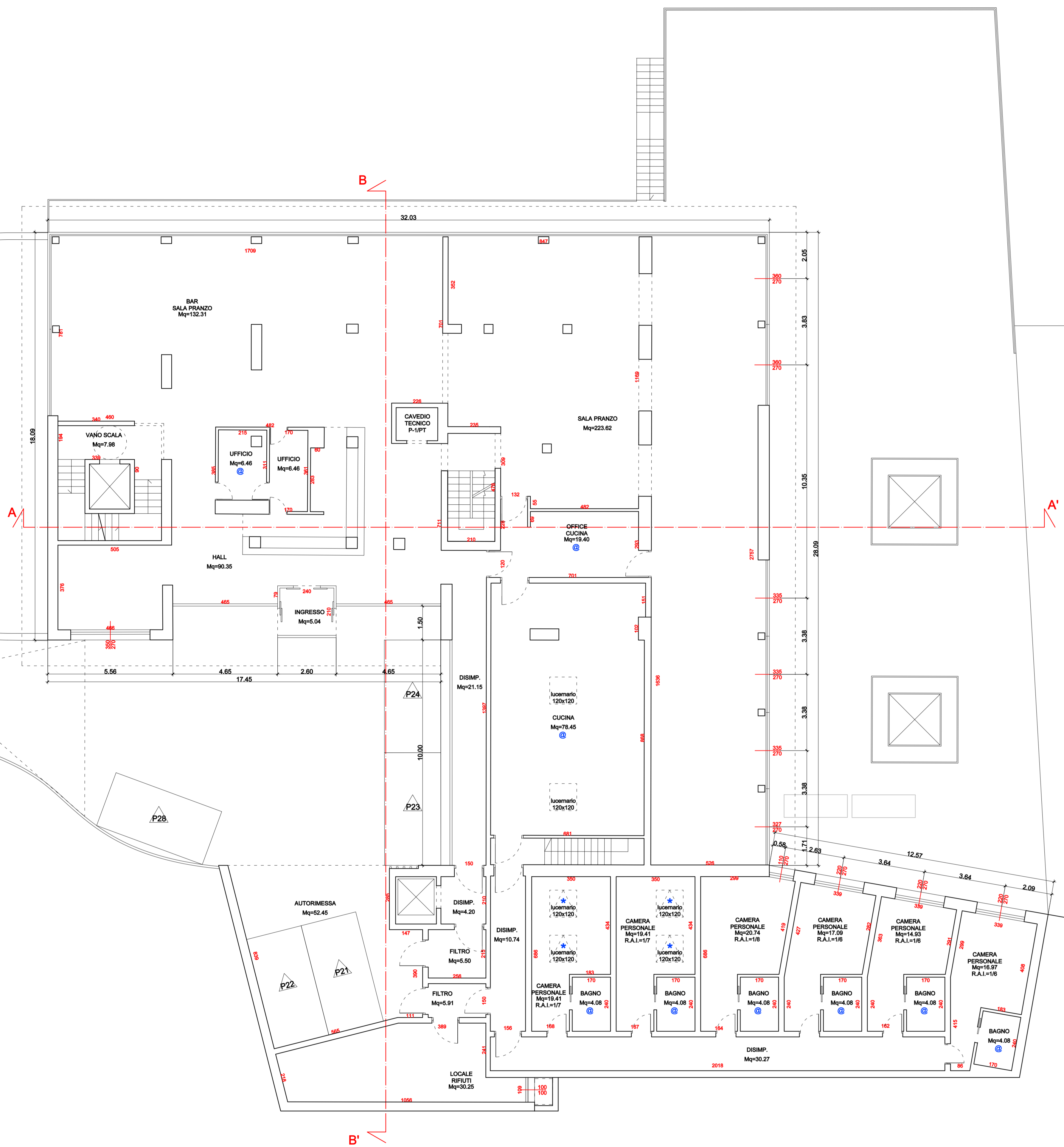
PIANTA PIANO TERRA - COMPARAZIONE Scala 1:100