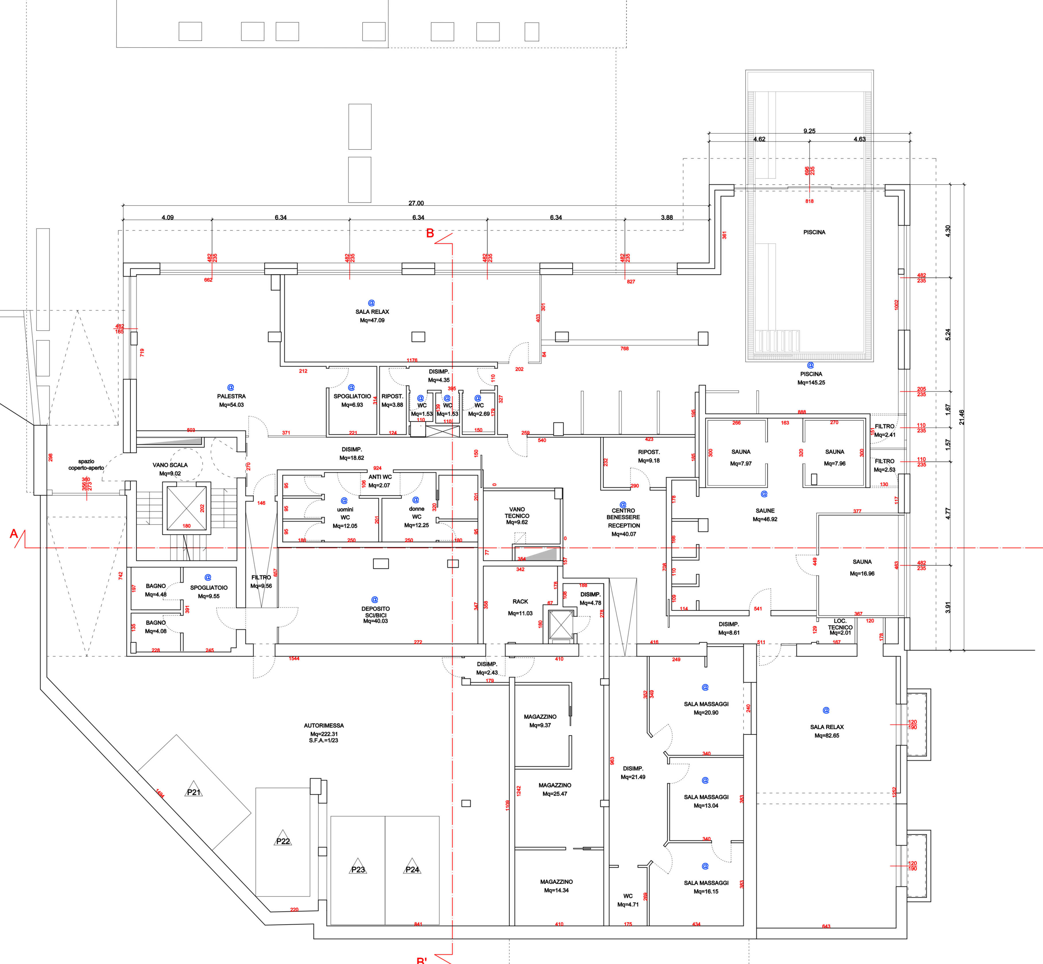
PIANTA PIANO PRIMO INTERRATO - VARIANTE Scala 1:100