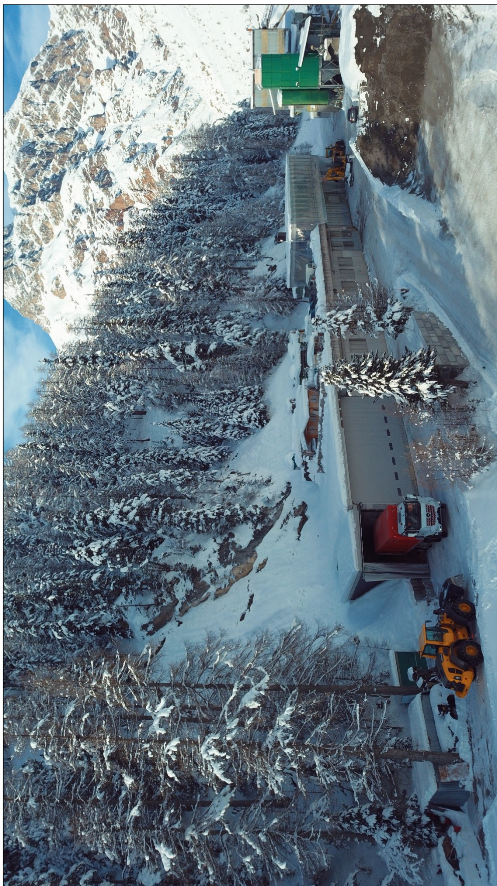
Foto.4 – Fronte nord (sullo sfondo blocco nuovi uffici in costruzione).