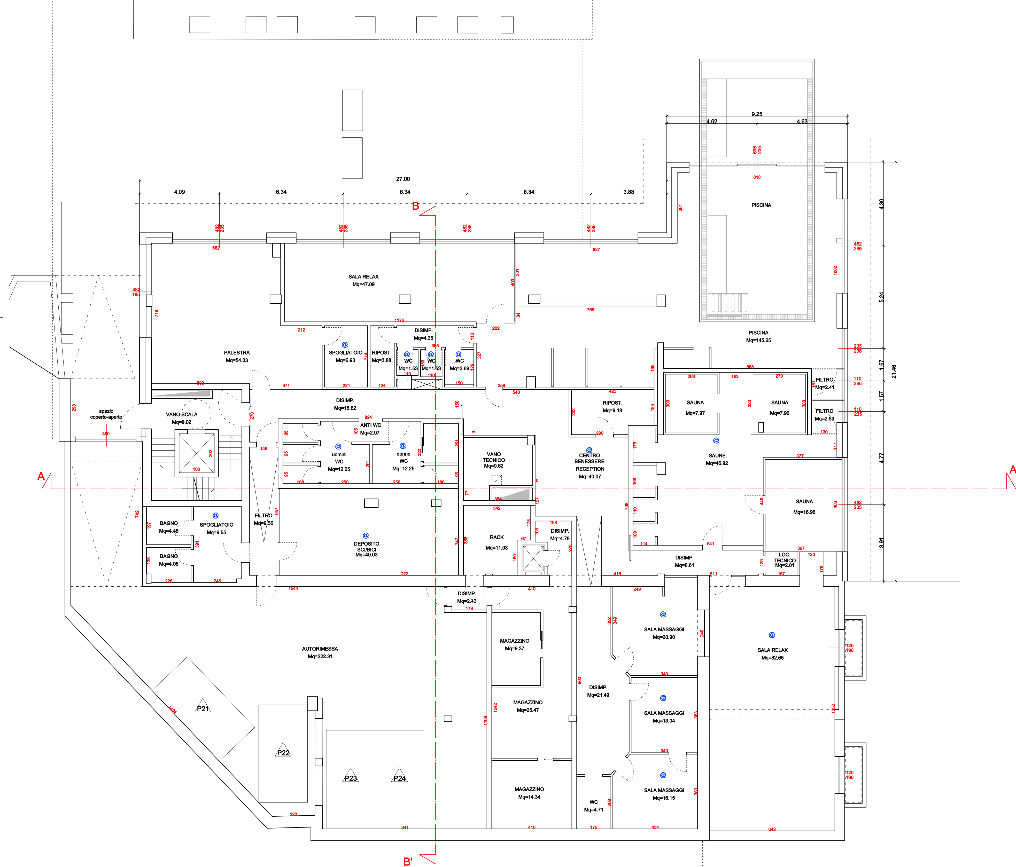
PIANTA PIANO PRIMO INTERRATO - VARIANTE Scala 1:100