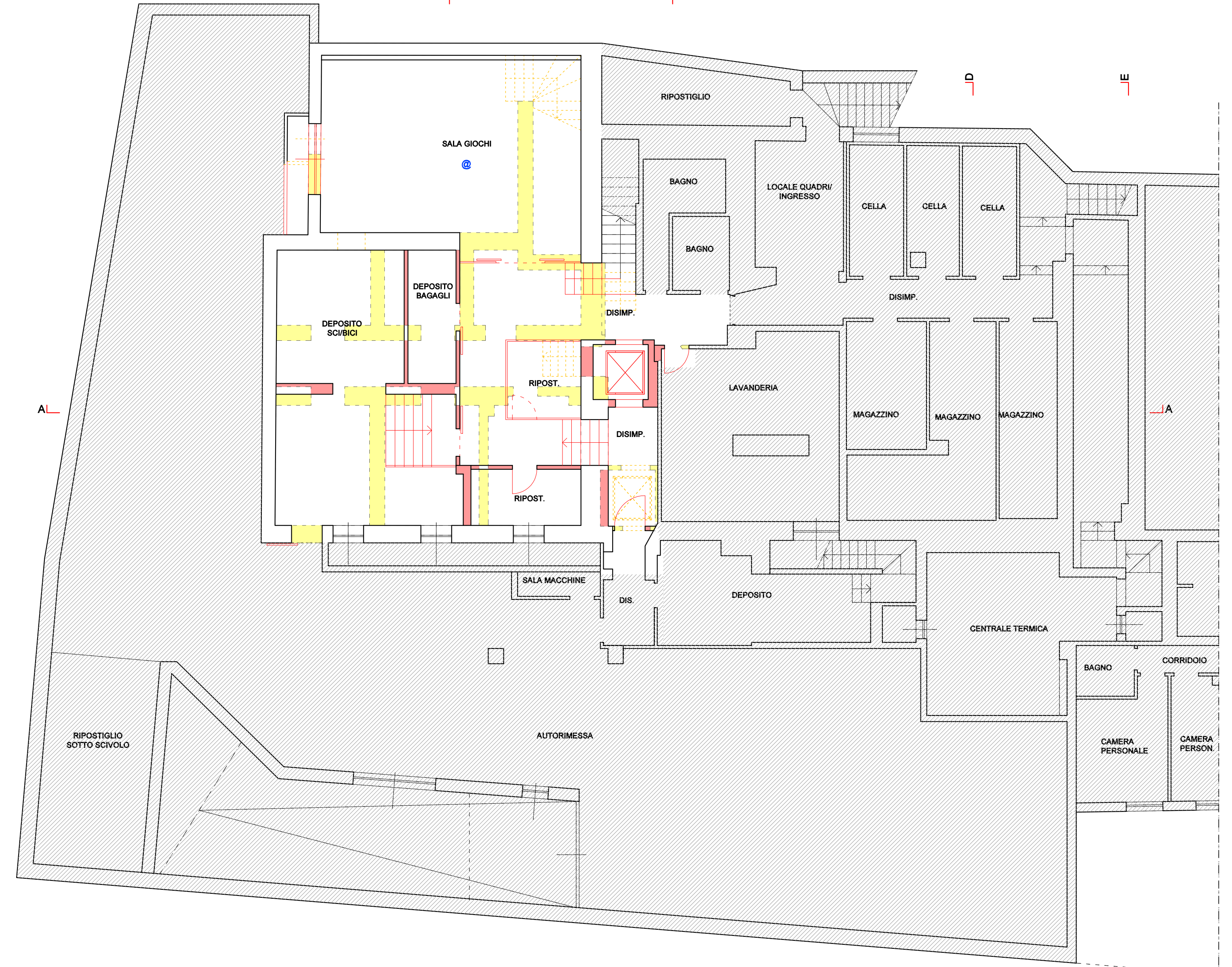
PIANTA PIANO INTERRATO - COMPARAZIONE Scala 1:100