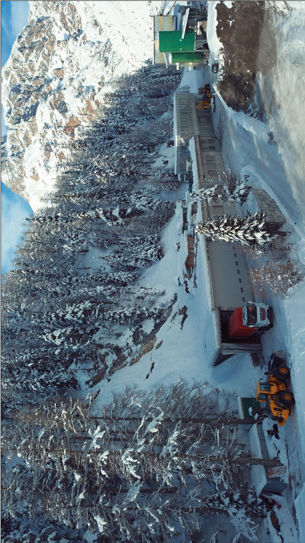
Foto.4 – Fronte nord (sullo sfondo blocco nuovi uffici in costruzione).