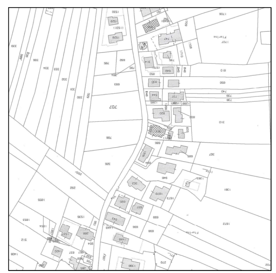
ESTRATTO MAPPA 1:2000